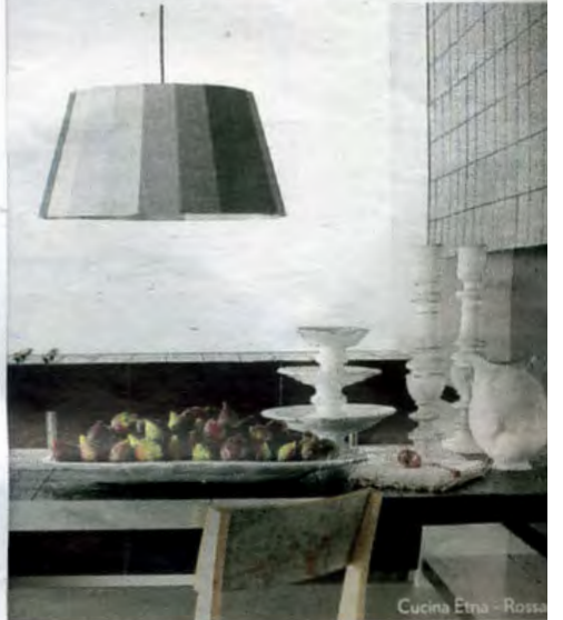
Cucina Etna - Rossa

plemento e all'accessorio, torna insieme al Salone osta di soluzioni che mettono in primo piano ricer