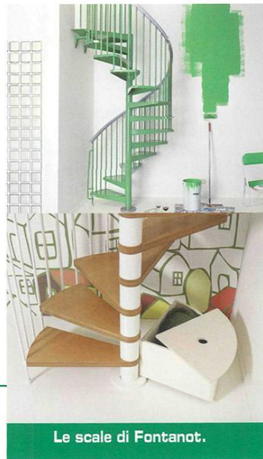
Le scale di Fontanot.